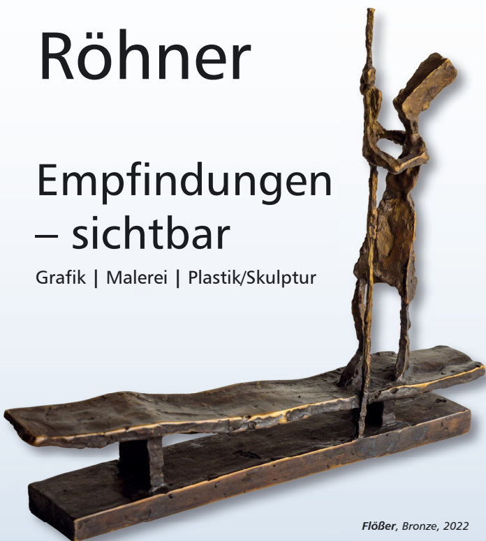
FlöBer, Bronze, 2022